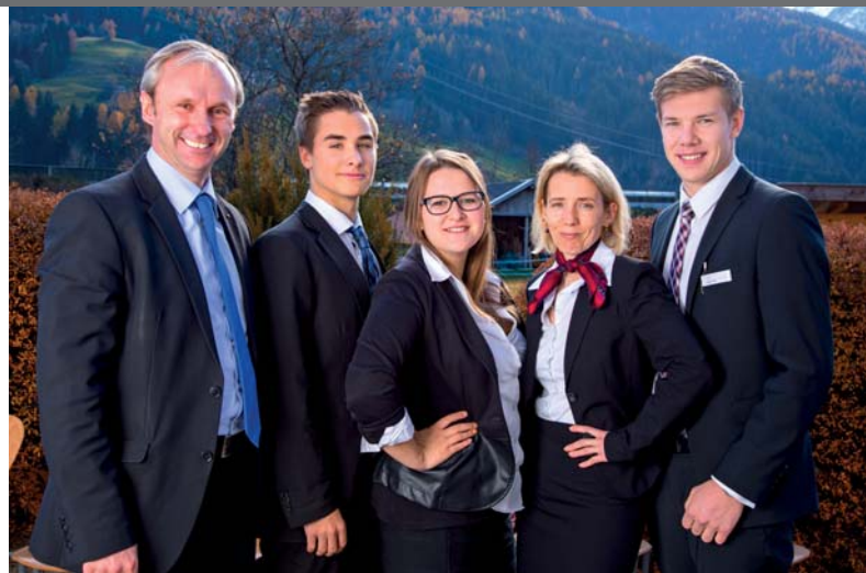
UNSER TEAM DER SCHULGEMEINSCHAFT