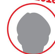
HÖHERE LEHRANSTALT FÜR WIRTSCHAFTLICH BERUFE - HLW „KULTUR- UND KONGRESSMANAGEMENT“

Zusätzlich machen wir Dich fit im Banken- und Versicherungswesen, damit Du bestmöglich für den Berufseinstieg vorbereitet bist!